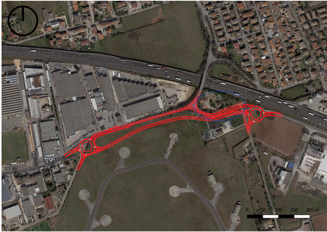
CARTA TECNICA REGIONALE | SCALA 1:5000